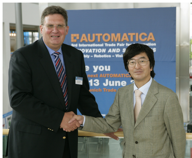
握手を交わす、丸山茂治 在ミュンヘン日本国総領事(右)と ミュンヘン見本市会社 常務取締役 N.H.バークマン

次回 AUTOMATICA 2008 は、ドイツ・新ミュンヘン国際見本市会場にて、2008 年 6 月 10 日～13 日開催予定。